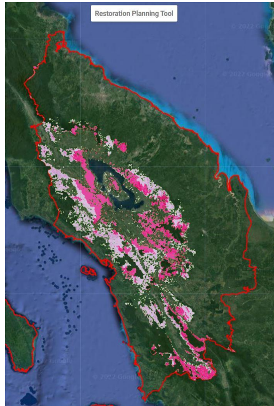
Gambar 3 Area Restorasi untuk kopi berkelanjutan Sumatera Utara